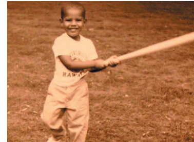
Nell'immagine, Barack da piccolo, in azione

Michelle Lavaughn Obama, il cui cognome da nubile è Robinson, è nata a Chicago il 17/01/64. Avvocato statunitense, è la moglie del 44° Presidente degli USA, Barack Obama. E' stata la prima donna afro-americana a diventare "first lady". E' nata e cresciuta nel South Side di Chicago e si è laureata alla Princeton University e alla Harvard L. S. Dopo aver completato la propria formazione, è tornata a Chicago dove ha lavorato come avvocato associato nella società