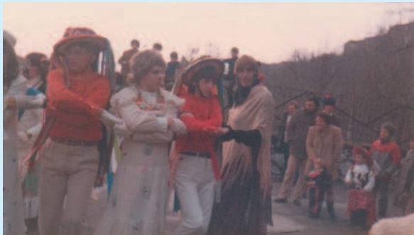
Nella pagina, rare foto della Zeza di Capriglia

Ingredienti: 210 gr di farina, 150 gr di burro, 2 uova, 1 cucchiaino di zucchero, 10 gr di lievito di birra, 40 gr di zucchero a velo, olio quanto basta, sale. Preparazione: Sbriciolate il lievito in una terrina e stemperatelo con 2 cucchiaini di acqua tiepida. Setacciatevi sopra circa 50 gr. di farina e lavorate gli ingredienti fino a formare una pasta soffice. Formate un panetto e mettetelo a lievitare. Disponete a fontana, sulla spianatoia, la rimanente farina; rompetevi 2 uova, aggiungete un pizzico di sale e lo zucchero. Lavorate energicamente gli ingredienti con le mani, tirando ripetutamente la pasta e sbattendola sul piano di lavoro. Dopo 10 minuti aggiungete 150 gr di burro e il lievito. Fatela riposare per almeno tre ore. Riprendete la pasta, lavoratela e poi in frigorifero per 24 ore. Tirate la pasta a forma di cilindro di un centimetro. Fatene pezzi di 10 cm. circa e altri di 15cm. e formate delle ciambelle e dei nodi. Fate friggere le girandole. Spolverizzatele con zucchero a velo e servitele.