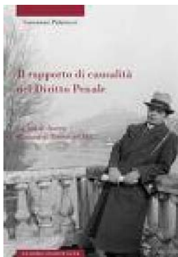
La tesi di laurea del martire, discussa a Torino con E. Florian, su uno dei problemi cruciali del diritto e della morale