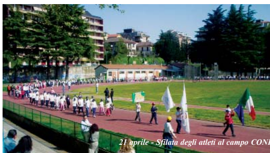
21 aprile - Sfilata degli atleti al campo CONI