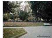
La Villa comunale di Avellino

"Lo Stretto". Tanto tempo fa la piazza era chiamata Piazza dei Tribunali perché il Palazzo Caracciolo ebbe la funzione di luogo amministrativo della giustizia. La piazza ha una forma rettangolare e più precisamente trapezoidale. Un lato della piazza è occupato da edifici non moderni di cui il più importante è il Palazzo Caracciolo che venne costruito tra il 1708 e il 1713. Davanti a questo palazzo ci sono due leoni che proteggono il portale d'ingresso.