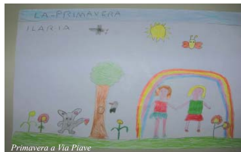
Primavera a Via Piave

Ideata dai bambini di 5 anni della Scuola dell'Infanzia di Capriglia